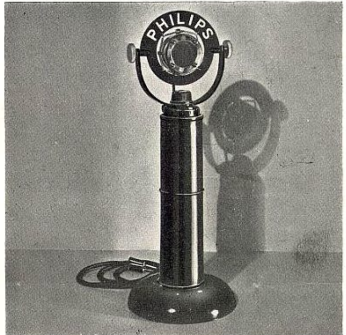
Stojánkový mikrofón Philips T 4247.